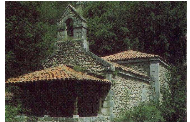
VALDEÓN -ERMITA CORONA-